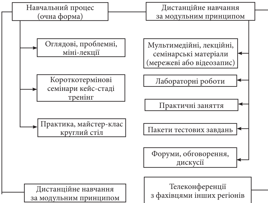
Рис.1. Модель інтеграції очної та дистанційної форми навчання.

Схематично цю модель навчання можна зобразити таким чином (Рис.1)